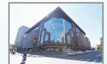
长春万达广场中心商业建设项目