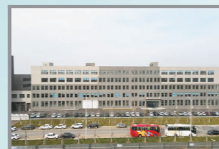
吉林省科英激光股份有限公司生产基地建设项目

长春市优质工程奖凝聚了集团公司全体建设者的辛勤劳动和汗水,体现了吉林建工较强的施工实力和综合管理水平。吉林建工将以此为契机,继续严格执行国家有关规范和技术标准,不断开拓创新,强化质量品牌意识,努力建造出更多精品工程,为振兴东北老工业基地战略作出贡献。