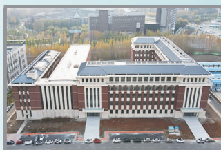
吉林大学综合极端条件实验装置项目