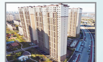
力旺·康城北一区(一期)G6#项目