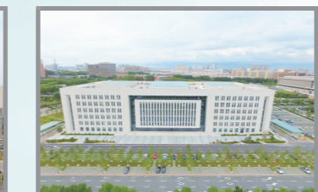
长春市政政务服务中心项目